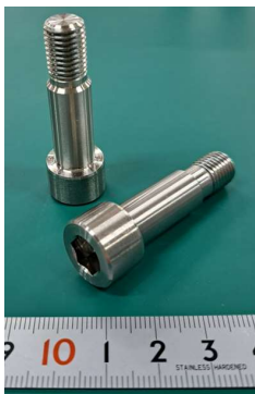
〈ニッケル合金ボルト〉 特徴:耐熱・耐食