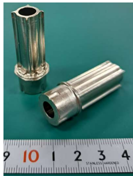
〈コアローター〉 特徴:複雑形状鍛造